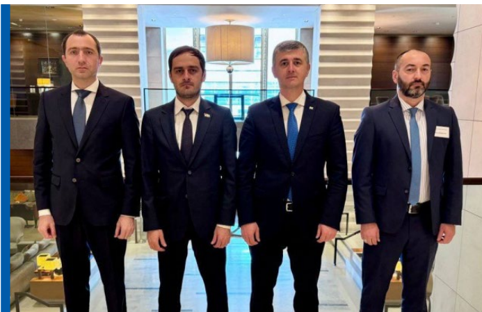
აფხაზური დელეგაცია ჟენევაში, მე-60 რაუნდი

2022 წლის თებერვალში უკრაინაში რუსეთის სრულმასშტაბიანი სამხედრო აგრესიის დაწყების შემდეგ ჟენევის ფორმატში შეხვედრების ადგილის მიმართ სულ უფრო გახშირდა მოსკოვის პრეტენზიები, რასაც სოხუმსა და ცხინვალშიც იზიარებენ. რუსეთის შეფასებით, შვეიცარია დაკარგა ნეიტრალური ქვეყნის სტატუსი, რადგან შვეიცარია შეუერთდა ევროკავშირის ანტირუსულ აქციებს და „სრულ სოლიდარობას უცხადებს კიევის რეჟიმს“. მოსკოვი ცდილობს ჟენევიდან მოლაპარაკებების რაუნდების გადატანაზე კონსენსუსს მიაღწიოს აფხაზი და ოსი მოკავშირეების მხარდაჭერით. სოხუმი და ცხინვალის მხარს უჭერენ მოსკოვს და ერთ-ერთ მიზეზად სავიზო პოლიტიკის გამკაცრებასაც ასახელებენ, რაც მათ ხელს უშლის შენგენის ქვეყნებში/შვეიცარიაში თავისუფლად გადაადგილებაში. ალტერნატიულ ადგილებად სახელდება ბელარუსი და სერბეთი, თუმცა ადგილის შეცვლისთვის საჭიროა თბილისის თანხმობაც.