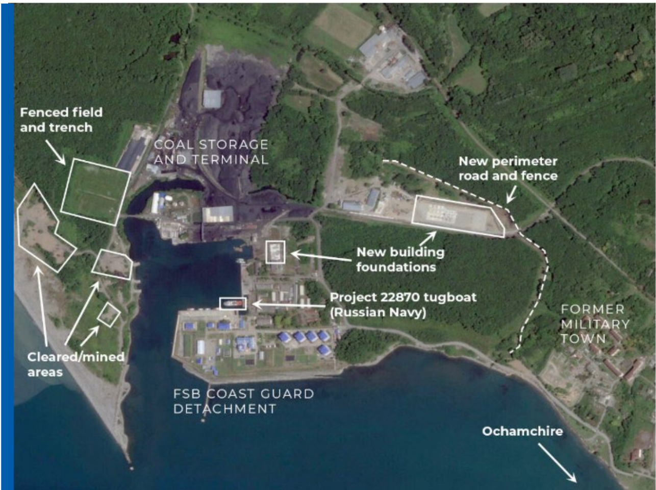
მიმდინარე სამუშაოების ამსახველი სატელიტური რუკა.