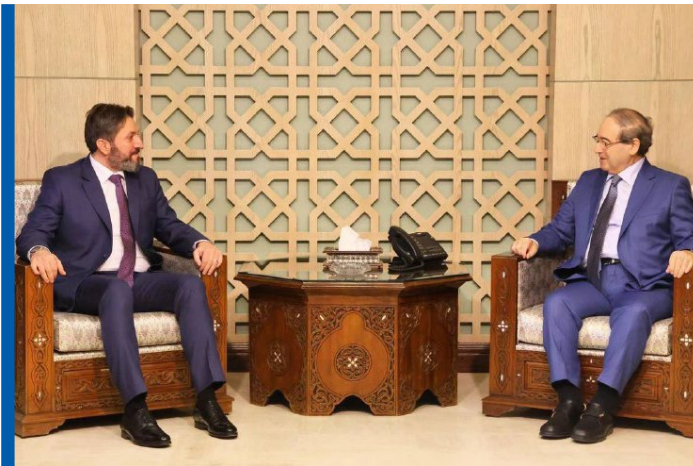
მუხამად ალი რნშუნებათა სიგელს გადასცემს სირიის საგარეო საქმეთა მინისტრს

2024 წელს ახლო აღმოსავლეთში აფხაზური „დიპლომატიის“ მთავარი სამიზნე სირია იყო, თუმცა 8 დეკემბერს ბაშარ ალ-ასადის დამხობის შემდეგ გაურკვეველია, თუ როგორ შეიძლება განვითარდეს ორმხრივი ურთიერთობები. დიდია ალბათობა, რომ სირიის ახალმა მთავრობამ უკან წაიღოს ოკუპირებული რეგიონების აღიარება. მიუხედავად იმისა, რომ ორმხრივი ურთიერთობები უფრო სიმბოლურ დატვირთვას ატარებდა და რეალური შედეგი არ მოჰყოლია, 2024 წელს აფხაზური „დიპლომატია“ სირიაში განსაკუთრებით აქტიურობდა. კერძოდ, სირიაში იანვარში აფხაზეთის „საელჩოში“ საკონსულო განყოფილება გაიხსნა , 1 თებერვალს