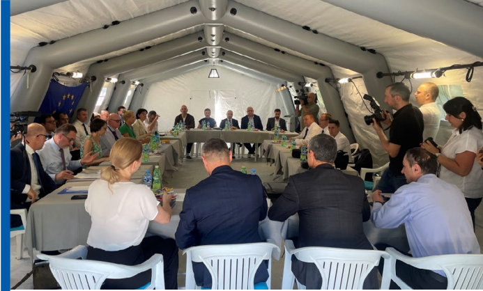
120-ე შეხვედრა ერგნეთში

ერგნეთში, ინციდენტების პრევენციისა და მათზე რეაგირების მექანიზმის ფორმატში, 2024 წელს ექვსი შეხვედრა გაიმართა. შვიდი შეხვედრა ჩატარდა 2023 წელს. ერგნეთში პირველი შეხვედრა 2009 წლის 23 აპრილს გაიმართა. ამ ფორმატში შეხვედრების ჩატარების გადანყვეტილება 2009 წლის 18-19 თებერვალს ჟენევის მოლაპარაკებების მე-6 რაუნდზე მიიღეს.