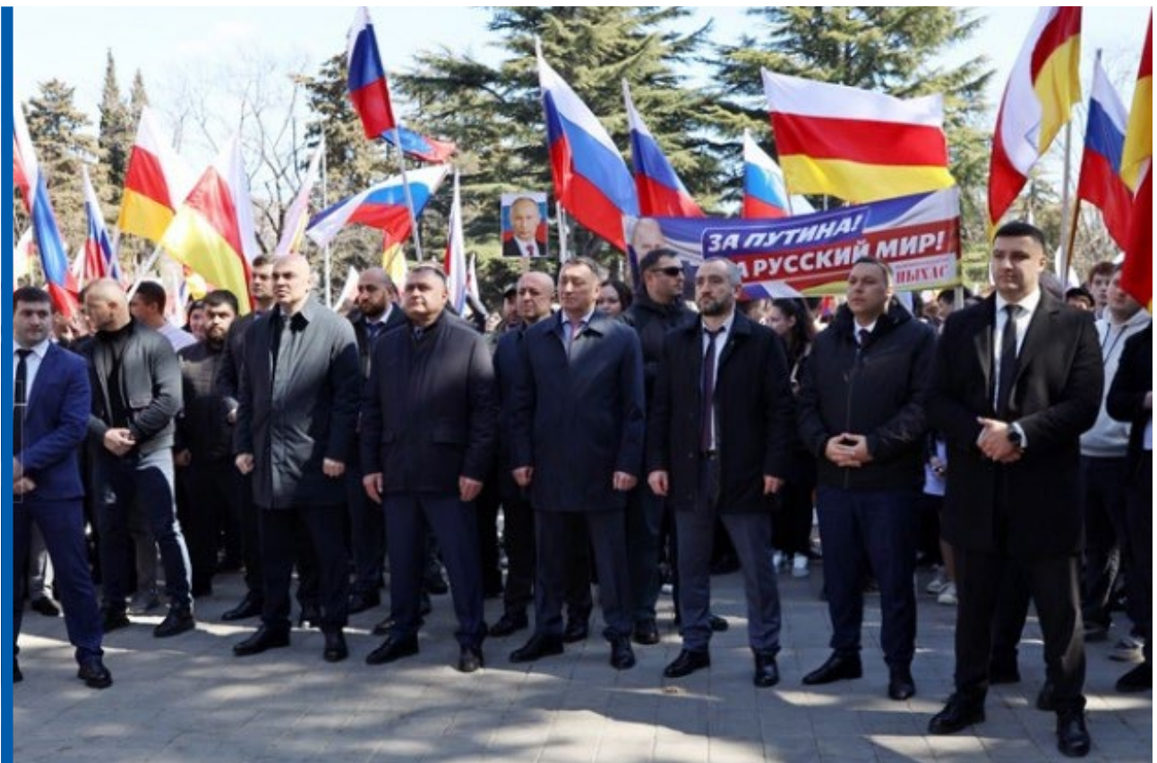
ვლადიმერ პუტინის მხარდამჭერი მიტინგი ცხინვალში

2024 წლის 15-17 მარტს რუსეთის საპრეზიდენტო არჩევნები ჩატარდა ოკუპირებულ რეგიონებშიც. წინასაარჩევნო პერიოდში ორივე რეგიონის დე ფაქტო ხელისუფლებამ სხვადასხვა ფორმატში რუსეთის მოქმედ პრეზიდენტ ვლადიმერ პუტინისადმი ღია მხარდაჭერა დააფიქსირეს. მაგ., ცხინვალში 12 მარტს პუტინის მხარდამჭერი მიტინგი დე ფაქტო პრეზიდენტის, ალან გაგლოვის, პარტია „ნისასის“ ორგანიზებით ჩატარდა. 12 მარტს სოხუმში პუტინის მხარდამჭერი ახალგაზრდობის ფორუმი ჩატარდა, რომელსაც დე ფაქტო ხელისუფლების წარმომადგენლებიც დაესწრნენ. არჩევნებში მონაწილეობა მიიღეს ოკუპირებული რეგიონების იმ მაცხოვრებლებმა, რომლებსაც რუსეთის მოქალაქეობა აქვთ. აფხაზეთში 30 საარჩევნო უბანი იყო გახსნილი, ცხინვალის რეგიონში – 12.