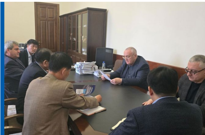
ალექსანდრ ანქვაბის შეხვედრა ჩრდილოეთ კორეის დელეგაციასთან

2024 წელს ოკუპირებული აფხაზეთის „დიპლომატიის“ განსაკუთრებული სამიზნე იყო BRICS -ის ჯგუფი, რომლის თავმჯდომარეც 2024 წელს რუსეთი იყო. აფხაზეთი ცდილობდა ეს შესაძლებლობა BRICS-ის წევრ ქვეყნებთან კავშირების დასამყარებლად გამოეყენებინა. ამ მხრივ ყველაზე დიდი მიღწევა იყო რუსეთის ქ. ყაზანში 12-23 ივნისს „BRICS-ის თამაშებში“ მონაწილეობა. ეს პირველი შემთხვევა იყო, როდესაც ოკუპირებული რეგიონების წარმომადგენლებმა მსგავსი მასშტაბის სპორტულ ღონისძიებაში საკუთარი „დროშით“ მიიღეს მონაწილეობა. მიუხედავად იმისა, რომ სპორტული ღონისძიება არ იყო მასშტაბური და კონკურენტული, მსგავს ღონისძიებებს აფხაზეთი და ცხინვალის რეგიონი პროპაგანდისტული მიზნებისთვის იყენებენ.