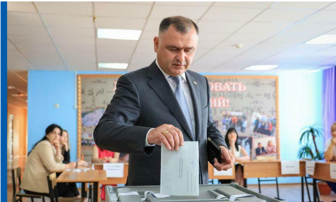
დე ფაქტო პრეზიდენტი ალან გაგლოვი „საარჩევნო“ უბანზე

ოკუპირებულ ცხინვალის რეგიონში რეგულარულად ტარდება არალეგიტიმური საპარლამენტო არჩევნები. 1992 წელს ცხინვალის რეგიონში შეიარაღებული კონფლიქტის დასრულების