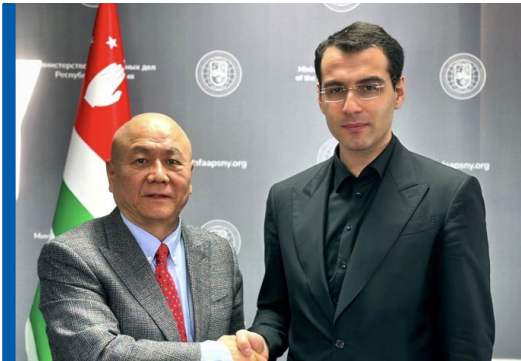
ინალ არძინბას შეხვედრა კე ჭილისთან

ტი საყურადღებოა უკრაინაში მიმდინარე რუსეთის სამხედრო აგრესიის ფონზე. ჩრდილოეთ კორეა რუსეთს სამხედრო აღჭურვილობით ეხმარება და სოხუმში მსგავსი ვიზიტის ფენიანსა და მოსკოვს შორის დაახლოების კონტექსტში უნდა განვიხილოთ. ამ ეტაპისთვის ორმხრივ ურთიერთობაში რაიმე პროგრესის შესახებ ინფორმაცია არ არის ხელმისაწვდომი.