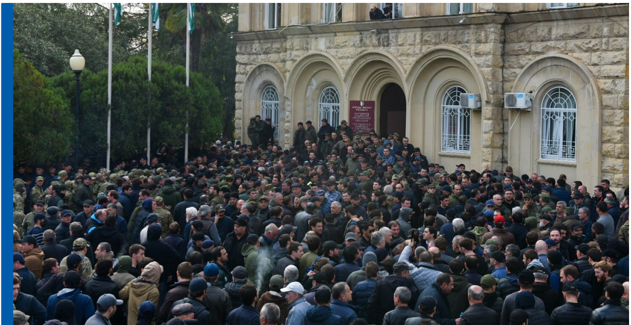
ასლან ბჟანიას მონინალმდეგეები „სამთავრობო“ შენობებთან

15 ნოემბერს ოკუპირებული აფხაზეთის და ფაქტო პარლამენტს რუსეთთან დადებული ე.წ. საინვესტიციო შეთანხმების რატიფიკაცია უნდა მოეხდინა, თუმცა საპროტესტო გამოსვლების გამო საკითხი დღის წესრიგიდან მოიხსნა. ამის მიუხედავად, „სამთავრობო“ შენობებთან შეკრებილმა მონინალმდეგეებმა რკინის დამცავი ჯებირები გაარღვიეს და „პარლამენტის“, „პრეზიდენტის ადმინისტრაციისა“ და „მთავრობის“ შენობები დაიკავეს.