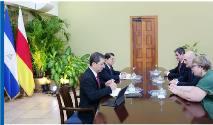
ახსარ ჯიოევის შეხვედრა ნიკარაგუის საგარეო საქმეთა მინისტრ დენის მონკადასთან

2024 წლის 19 ივლისს ნიკარაგუაში სანდინისტური რევოლუციის 45-ე წლისთავი აღინიშნეს. საზეიმო ღონისძიებაში მონაწილეობა მიიღო დე ფაქტო საგარეო საქმეთა მინისტრმა ახსარ ჯიოევმაც. ნიკარაგუა გაეროს წევრი ერთ-ერთი ის ქვეყანაა, რომელიც ოკუპირებული რეგიონების დამოუკიდებლობას აღიარებს. უნდა აღინიშნოს, რომ, აფხაზეთისგან განსხვავებით, ცხინვალის რეგიონის წარმომადგენლების საგარეო ვიზიტები უფრო იშვიათია.