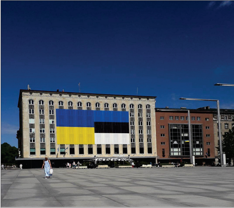
თავისუფლების მოედანი, ტალინი, 2022