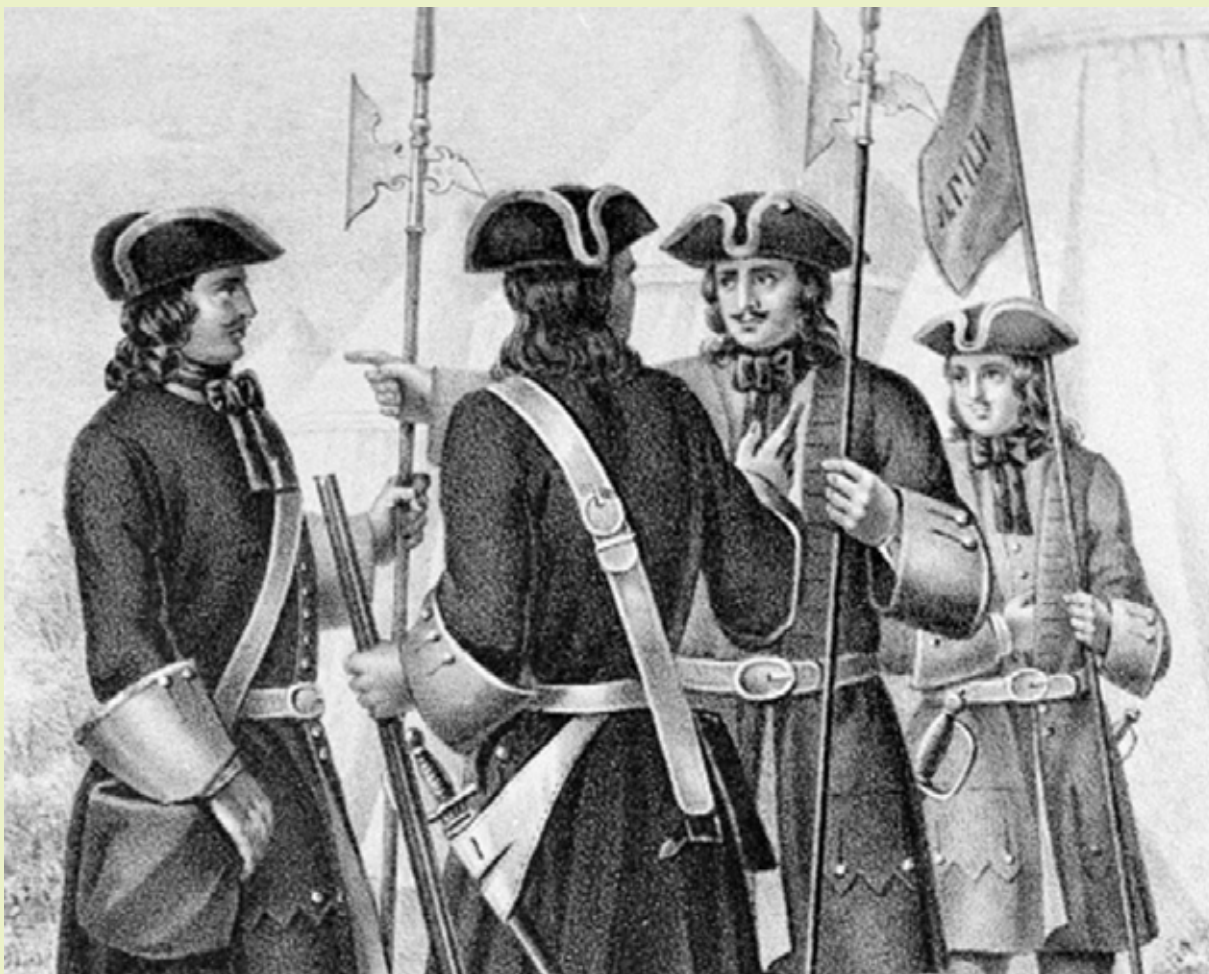
პეტრე პირველი და პრეობრაჟენსკის პოლკის ოფიცრები

დე უცნობია. პეტრე დიდის გარდაცვალების შემდეგ ეს სამსახურიც დაიშალა. 1826 წელს, დეკემბრისთა აჯანყებიდან რამდენიმე თვეში, იმპერატორმა ნიკოლოზ პირველმა იმპერიული კანცელარიის „მესამე განყოფილება“ შექმნა, რომელსაც პოლიტიკური წესრიგის შენარჩუნება დაევა. მესამე განყოფილების პირველმა ხელმძღვანელმა, გრაფმა ბენკენდორფმა, უმთავრეს მიზნად საზოგადოებრივი აზრის მონიტორინგი და კონტროლი დაისახა. მისი დავალებით დაიწყო საზოგადოებრივი აზრის ყოველწლიური გამოკითხვის ჩატარება, რომელსაც ეწოდებოდა „მორალური და პოლიტიკური ვითარება რუსეთში“.