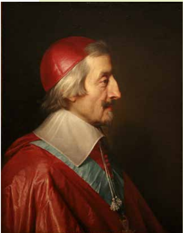
კარდინალი რიხელი , მხატვარი ფილოპ დე შამპან, 1642

მოგვიანებით დაზვერვის ინგლისელმა დიდოსტატმა სერ ფრენსის უოლსინჰემმა (1532-1590) მსოფლიოს ერთ-ერთ ყველაზე გავლენიან სადაზვერვო სამსახურს ჩაუყარა საფუძველი. დედოფალ ელისაბედის სახელმწიფო მდივანი პრაქტიკულად ყველა დიდი წამონყების უკან იდგა. ფაქტობრივად, არ არსებობს დაზვერვის რაიმე ხერხი, რომელიც მას არ გამოეყენებინოს. მან გადმოიბირა ოქსფორდისა და კემბრიჯის საუკეთესო კურსდამთავრებულები, რომლებსაც საფრანგეთში აგზავნიდა სასწავლებლად, რათა მათ შემდგომ მუშაობა დაეწყოთ საფრანგეთის მეფის კარზე და ფრანგების საიდუმლო გეგმები ლონდონისთვის მიეწოდებინათ. მისი მითითებით, დამკვიდრებულ პრაქტიკად იქცა წერილების გახსნა, წაკითხვა, ხელახლა დაბეჭდვა და დანიშნულებისამებრ გაგზავნა. სწორედ ამ ტექნიკის მეშვეობით შეიქმნა უოლსინჰემმა მარიამ სტიუარტის შეთქმულების შესახებ. მის მიერ სპეციალურად დაქირავებულმა კრიპტო-ანალიტიკოსმა თომას ფელიქსმა დაშიფრული წერილი გაშიფრა, რასაც საბოლოოდ შოტლანდიის დედოფლის დაკავება და დასჯა მოჰყვა.