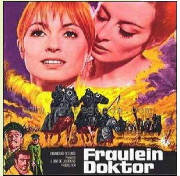
ფილმ „ფროილიან დოქტორის“ აფიშა

დასავლეთის ფრონტზე ბრიტანეთის კონტრდაზვერვამ დაინახა შრაგმიულერის მეთოდების ეფექტურობა. გერმანელი აგენტების დაჭერა გაცილებით უფრო გაძნელდა, ისინი უკეთ მომზადებული იყვნენ და მეტ წარმატებას აღწევდნენ. დროთა განმავლობაში ბრიტანელებმა შეიტყვეს ფროილიან დოქტორის არსებობის შესახებ და მის გამოსავლენად რამდენიმე ოპერაცია დაგეგმეს. არც ერთი მათგანი წარმატებული არ აღმოჩნდა. შრაგმიულერი ვინაობას იცვლიდა, სხვადასხვა ადგილას ცხოვრობდა და შენიღბვის სხვადასხვა დონეს იყენებდა. გარკვეული ხნის განმავლობაში ის მოხუცი დამლაგებელი ქალის საფარქვეშ ცხოვრობდა ანტვერპენში.