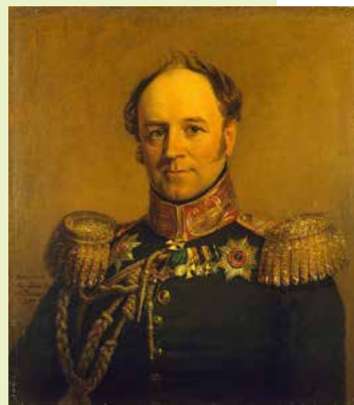
გრაფი ბანკენდორფი (1782-1844) – რუსეთის იმპერიის გენერალ-ადიუტანტი, „მესამე განყოფილების“ პირველი ხელმძღვანელი

1800 წელს „მესამე განყოფილება“ გაუქმდა და მისი ფუნქციები პოლიციის დეპარტამენტში შიდა უსაფრთხოებაზე პასუხისმგებელ დანაყოფს გადაეცა. XIX ს-ის ბოლოს რუსეთის გარეთ იმდენი რუსი რევოლუციონერი, სტუდენტი და ემიგრანტი ცხოვრობდა, რომ მათზე ზედამხედველობის გარეშე იმპერატორები ტახტს ვერ შეინარჩუნებდნენ. ოხრანა აგზავნიდა აგენტებს მთელ ევროპაში, რომლებიც სხვადასხვა ემიგრ