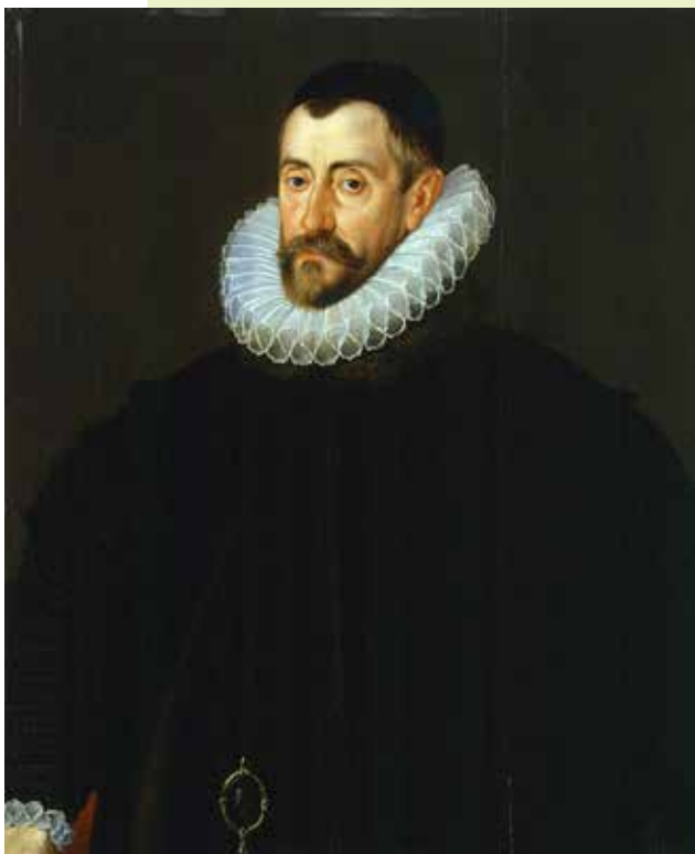
სერ ფრანსის უოლსინჰემი , მხატვარი ჯონ დეკრიცი, 1585

ბი ჰქონდა, რომლებიც სადაზვერვო ინფორმაციის შეგროვებით იყვნენ დაკავებული.