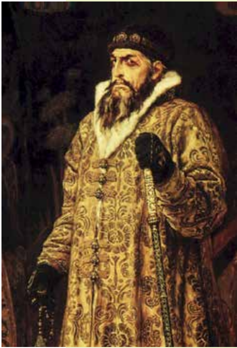
ივანე მრისხანა , მხატვარი ვ. მ. ვასნეცოვი, 1897

ეს ქსელი ასევე მეხუთე კოლონის როლს ასრულებს, რომელიც მომავალი დამპყრობლის მიმართ შიშს აღვივებს და ამით სამოქალაქო მოსახლეობის მორალს ძირს უთხრის და წინააღმდეგობის განწევის უნარს ასუსტებს. მანამდე შპიონაჟის სამიზნე მაღალჩინოსნები და პრივილეგიებული ფენის წარმომადგენლები იყვნენ. შტიბერის სამსახური კი ასევე იბირებდა ფერმერებს და პატარ-პატარა მაღაზიების მფლობელებს, მიმტანებს და დამლაგებლებს. მან ეს მეთოდი 1866 წელს ავსტრიაში და 1870 წელს საფრანგეთში სამხედრო ინტერვენციების მოსამზადებლად გამოიყენა. ორივე სამხედრო კამპანია პრუსიის ბრწყინვალე გამარჯვებით დამთავრდა.