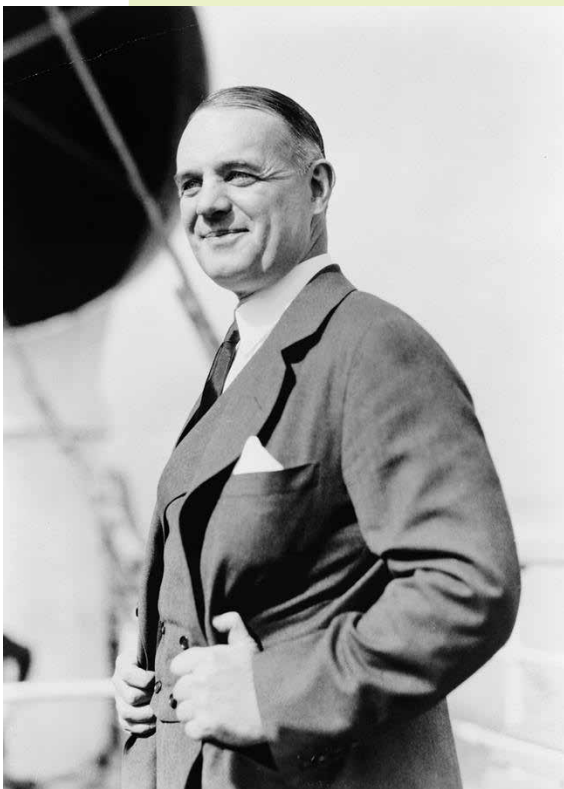
უილიამ დონოვანი (1883-1959) – სტრატეგიული მომსახურების ოფისის ხელმძღვანელი

დიდ სახელმწიფოთა შორის ამერიკის შეერთებულმა შტატებმა სადაზვერვო სამსახურები ყველაზე გვიან შექმნა. ჯორჯ ვაშინგტონისა და აბრაამ ლინკოლნის მიერ დაზვერვის გამოყენება ახლადდაარსებული რესპუბლიკისთვის გამონაკლისი უფრო იყო, ვიდრე წესი. ამერიკაში ჯაშუშობა ჯენტლმენისთვის შეუფერებელ საქმიანობად მიიჩნეოდა. პირველი თანამედროვე, მუდმივმოქმედი სადაზვერვო სამსახური – სტრატეგიული მომსახურების ოფისი უილიამ დონოვანის ხელმძღვანელობით მეორე მსოფლიო ომის დროს, 1942 წელს დაარსდა. 1947 წელს ეროვნული უსაფრთხოების აქტით შეიქმნა მისი მემკვიდრე ორგანიზაცია – ცენტრალური სადაზვერვო სააგენტო. დღეს ამერიკას ჩვიდმეტი სადაზვერვო სამსახური აქვს. ეს მსოფლიოში ყველაზე დიდი და ძვირადღირებული სადაზვერვო სისტემაა.