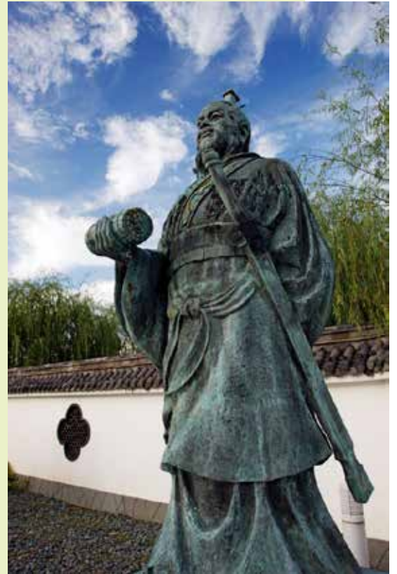
ჩინელი მხედართმთავარი სუნ ძი , ავტორი ტრაქტატისა „ომის ხელოვნება“

ყოფთ, მისი მოპოვება ადამიანებისგან შეიძლება და იგი იქვე გვთავაზობს აგენტების კლასიფიკაციას: 1) ადგილზე მყოფი აგენტები, ანუ მოწინააღმდეგე ქვეყნის დაბალი სახელმწიფო რანგის მქონე ინფორმატორები, 2) „თხუნელები“ – მოწინააღმდეგის მაღალჩინოსანთა შორის ჩანერგილი აგენტები, 3) ორმაგი აგენტები – მოწინააღმდეგის მიერ გამოგზავნილი აგენტები, რომელთა გადაბირება ხდება, რათა მტერს მცდარი ინფორმაცია მიანოდონ, 4) პროვოკაციის აგენტები, რომლებიც მოწინააღმდეგის დასაბნევად, ნასაქეზებლად ან მოსახლეობაში პანიკის დასათესად გამოიყენებიან, 5) მალემსრობლები, რომელთაც სადაზვერვო ინფორმაცია აქეთ-იქით მიაქვთ. ამ კლასიფიკაციას მხოლოდ მცირე ადაპტაცია დასჭირდა XX საუკუნეში. სუნ ძის „ომის ხელოვნება“ უძველესი ნაწარმოებია, რომელიც დაზვერვას კონცეპტუალურად განიხილავს და არაერთ პრაქტიკულ რჩევას იძლევა, რომელსაც ყავლი დღესაც არ გასვლია.