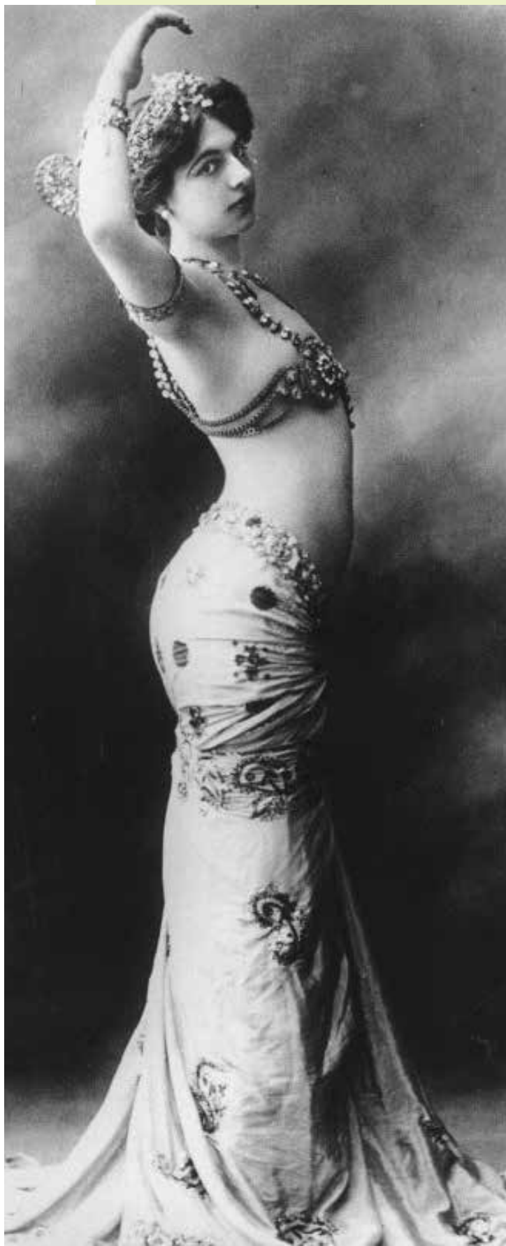
დაზვერვის ლეგენდა მატა ჰარი , იგივე მარგარეტა ზელე

შრამიულერმა 1913 წელს ფრაიბურგის უნივერსიტეტში პოლიტიკურ მეცნიერებებში სადოქტორო დისერტაცია დაიცვა. როცა ომი დაიწყო, ის მოხალისედ ჩაენერა გერმანიის შეიარაღებულ ძალებში. შრამიულერი თავდადებული გერმანელი პატრიოტი იყო და მოითხოვა უშუალოდ ფრონტზე გაეშვათ საბრძოლველად. სამხედრო მეთაურებმა ამაზე უარი უთხრეს. სამაგიეროდ, რახან ახალგაზრდა გოგონა 4 ენას ფლობდა თავისუფლად, ის არმიის საფოსტო ცენტრის ბიუროში გაამწესეს გერმანელების მიერ ოკუპირებული ბრიუსელის ტერიტორიაზე.