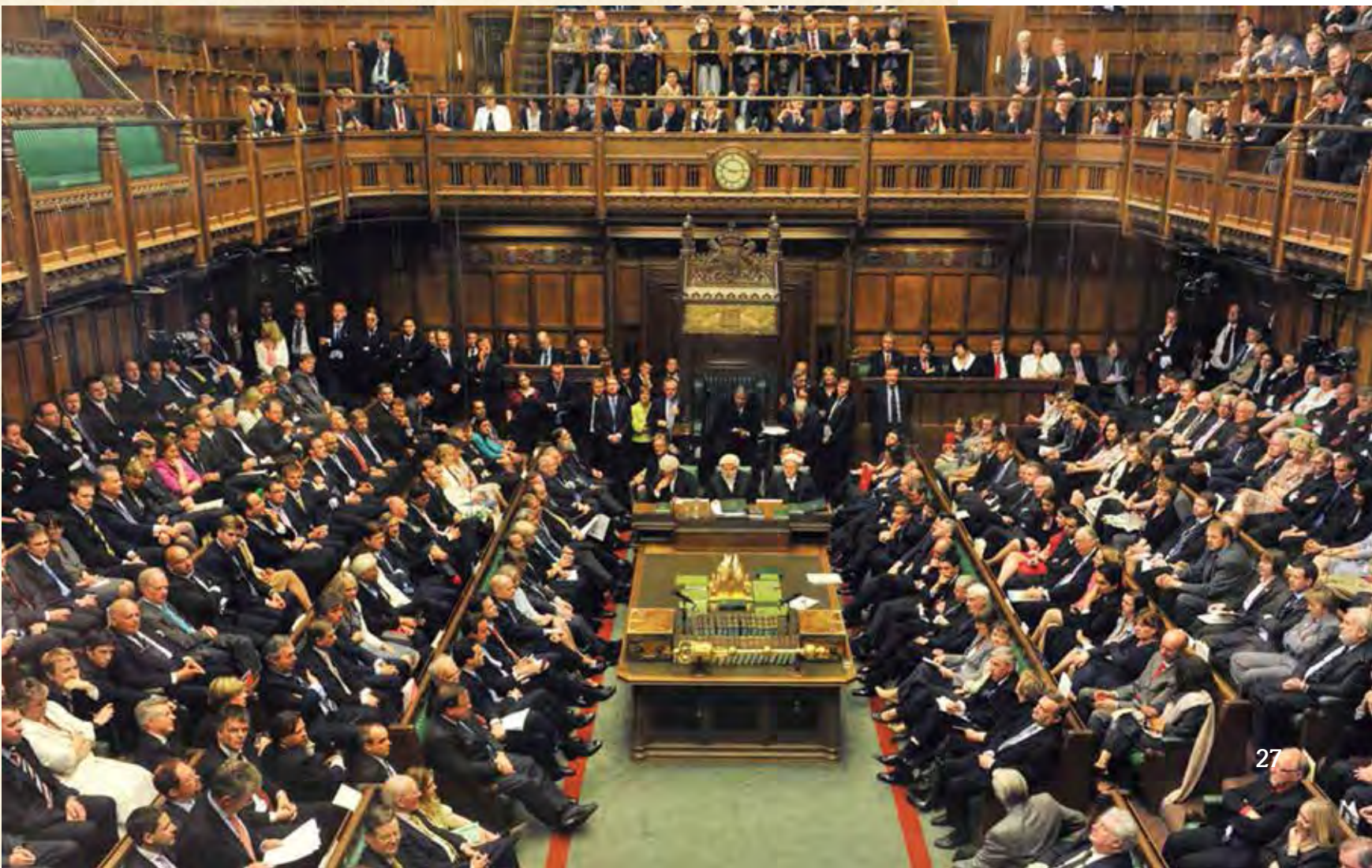
დიდი ბრიტანეთის პარლამენტის სხდომა