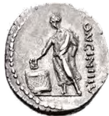
კასიუს ლონგინუსის დროს მოჭრილი დინარი (ლითონის ფული), ძვ.წ.63, გამოსახულია რომაელი მამაკაცი ხმის მიცემისას.

ყველა შემთხვევაში ექსტრემისტული მსოფლმხედველობა ცდილობს, საზოგადოებრივი და სახელმწიფოებრივი ცხოვრებიდან განდევნოს ყველა, ვინც განსხვავებულია. საქმე ის არის, რომ, რაც არ უნდა ერქვას მას, იგი უფრო ემოციურია და კოლექტიურ ვნებებს ეყრდნობა, ვიდრე რა-