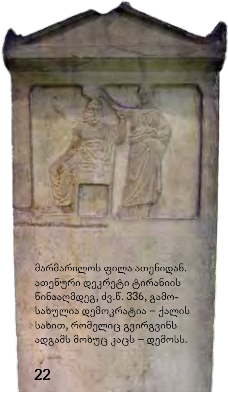
მარმარილოს ფილა ათენიდან. ათენური დეკრეტი ტირანიის წინააღმდეგ, ძვ.წ. 336, გამოსახულია დემოკრატია – ქალის სახით, რომელიც გვირგვინს ადგამს მოხუც კაცს – დემოსს.

კანონმდებლობა, როგორი იდეალურიც არ უნდა იყოს, ადამიანებისა და მათი უნარების გარეშე ვერ „იმუშავებს“. განვლილმა ოცდახუთმა წელმა ჩვენი ქვეყნის უახლეს ისტორიაში დაგვანახა ბევრი წინააღმდეგობა, რომელიც ჯერაც გადასალახი გვაქვს საიმისოდ, რომ ჩვენს საზოგადოებასა და სახელმწიფოებრივ სისტემას დემოკრატიული ერქვას.