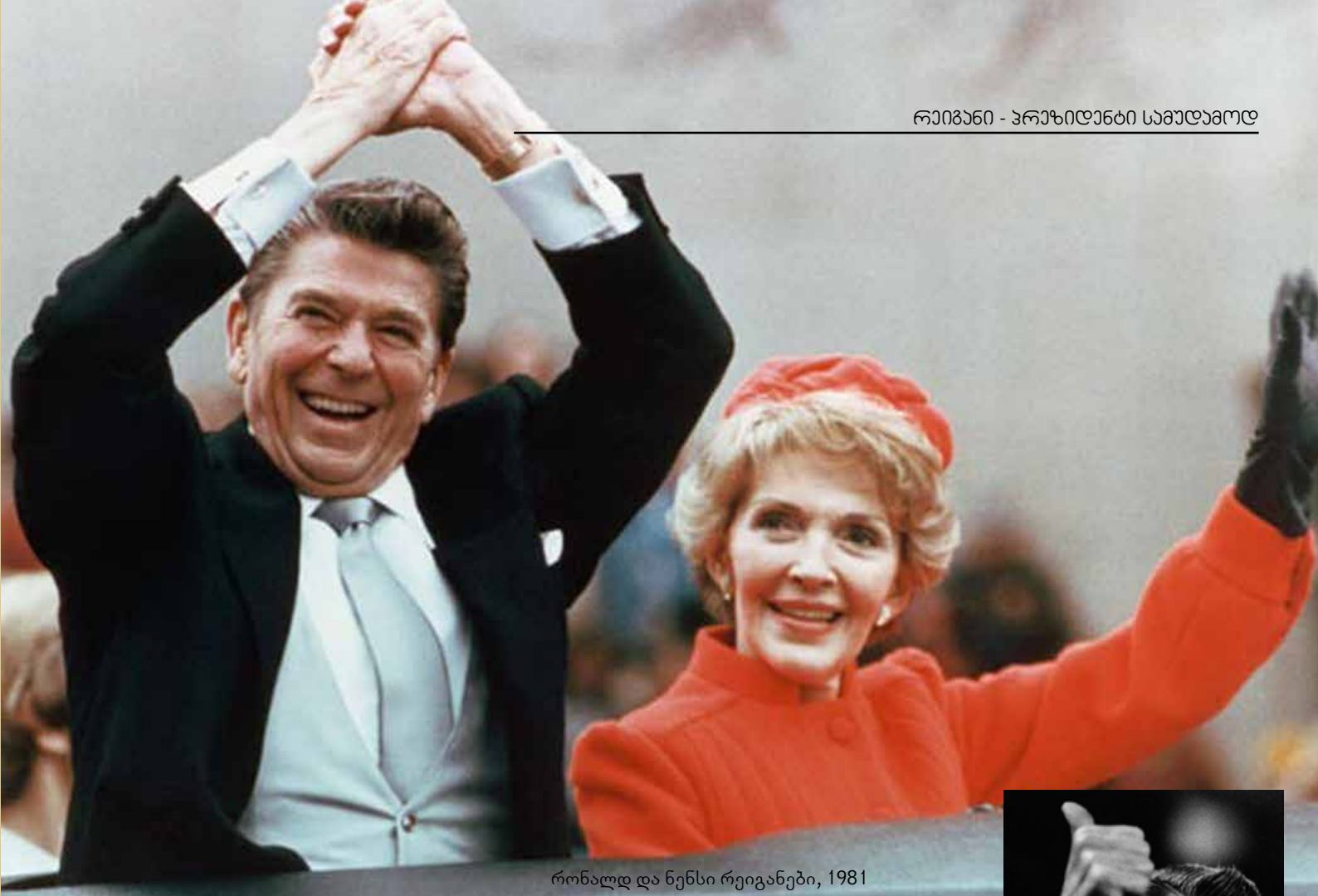
რონალდ და ნენსი რეიგანები, 1981