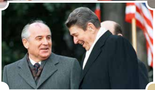
რონალდ რეიგანი და მიხაილ გორბაჩოვი, 1987

აცნობიერებდა ფაქტს, რომ ბოლო პერიოდში საბჭოთა კავშირის შეიარაღება ძალიან გაძლიერდა. ამიტომ გადანყვიტა, მოსკოვთან სერიოზული მოლაპარაკებები მხოლოდ მაშინ წამოეწყო, როცა სათანადოდ მიხედავდა ამერიკის შეიარაღებას, რადგან ამის შემდეგ კომუნისტებთან მოლაპარაკებებში გაცილებით ძლიერი პოზიციები ექნებოდა. მან ორი საინტერესო