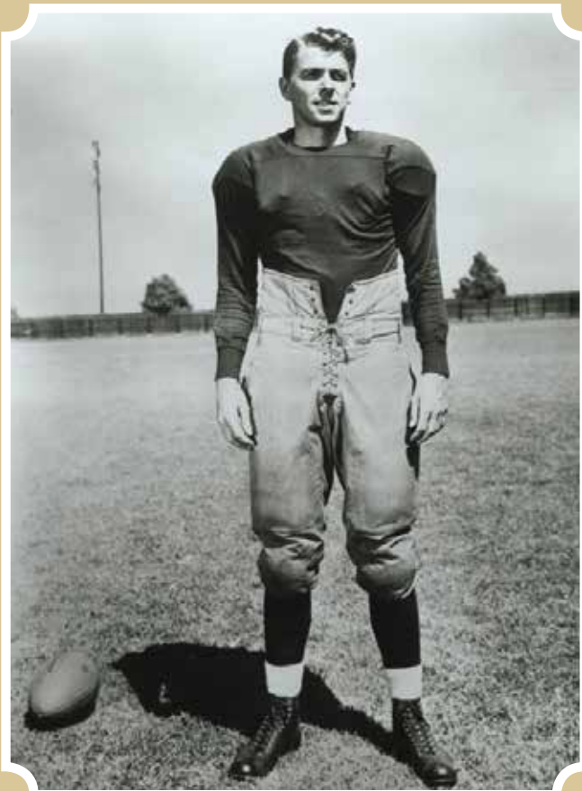
კადრი ფილმიდან „კნუტ როკნე – ნამდვილი ამერიკელი“, 1940

რონალდი ბავშვობიდან თამაშობდა ამერიკულ ფეხბურთსა და ბეისბოლს. ბეისბოლის თამაში ძალიან უჭირდა, რის გამოც სერიოზული კომპლექსიც ჩამოუყალიბდა. მიზეზი სრულიად შემთხვევით გაირკვა ერთ დღეს, როცა რონალდმა უბრალოდ სათამაშოდ მოირგო დედის სათვალე და აღმოაჩინა, რომ საშინლად ახლომხედველი ყოფილა. თურმე, მოზარდობამდე ამერიკის მომავალი პრეზიდენტი ნახევრად სიბრმავეში იზრდებოდა იმიტომ, რომ მის გაჭირვებულ ოჯახს არასდროს უფიქრია იგი პროფილაქტიკისთვის თვალის ექიმთან მიეყვანა.