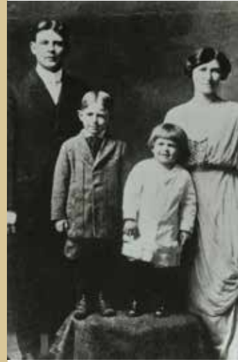
რონალდ რეიგანი უფროს ძმასა და მშობლებთან ერთად, 1913

რონალდ რეიგანი დაიბადა 1911 წელს ამერიკის შტატ ილინოისის პატარა ქალაქში. მისი ოჯახი ძალიან ღარიბი იყო, ხშირად დედა პატარა რონალდს ყასაბთან აგზავნიდა და აბარებდა ღვიძლი ეთხოვა „კატისათვის“. იმ დროს ამერიკაში ღვიძლს თითქმის არავინ ჭამდა და რონალდს მას უფასოდ აძლევდნენ კატისათვის, რომელიც სინამდვილეში არ არსებობდა, უბრალოდ, დედას არ უნდოდა ვინმეს გაეგო, რომ იგი ოჯახს ღვიძლს აჭმევდა (ხორცს კი ხელმოკლე ოჯახი იშვიათად ყიდულობდა). რონალდის მამა, ჯეკ რეიგანი, მუდამ შრომობდა, რომ მრავალშვილიანი ოჯახი როგორმე გამოეკვება და თან საკუთარ ალკოჰოლიზმს ებრძოდა. იგი ძირითადად კომივოიაჟერობით იყო დაკავებული (ბევრს მოგზაურობდა და სხვადასხვა საქონელს ყიდდა). შესაბამისად, ბევრ ადამიანთან უნევედა ურთიერთობა, რამაც, როგორც ჩანს, ამბების მოყოლისა და ადამიანების გაცინების ნიჭი განუვითარა. ეს ნიჭი რონალდსაც გამოჰყვა და მამის გავლენით იგი ამაში კარგადაც გაინაფა. მომავალში პოლიტიკოს რეიგანის ერთ-ერთი უდიდესი უპირატესობა სწორედ ეს იყო: მას შეეძლო ერთი ხუმრობით, ერთი ანეგდოტის მოყოლით მიემხრო აუდიტორია და დებატებიც მოეგო. როცა პრეზიდენტი გახდა, იგი ანეგდოტებს საბჭოთა კავშირზე ყვებოდა და ამით მთელ მსოფლიოს აჩვენებდა, რომ კომუნისტური იმპერია არც ისე საშიში იყო, როგორც ეს მაშინ ბევრს ეჩვენებოდა.