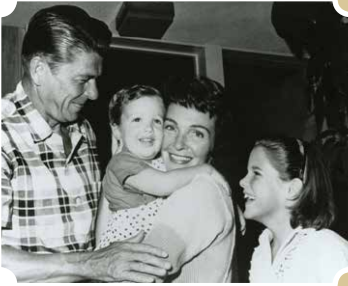
რონალდ და ნენსი რეიგანები შვილებთან ერთად

ირობა მისი მმართველობის სტილიც. იგი თანამდებობებს წესიერ ადამიანებს აბარებდა, მათ დავალებებს აძლევდა და შემდეგ თითქმის ყველაფერს ანდობდა.