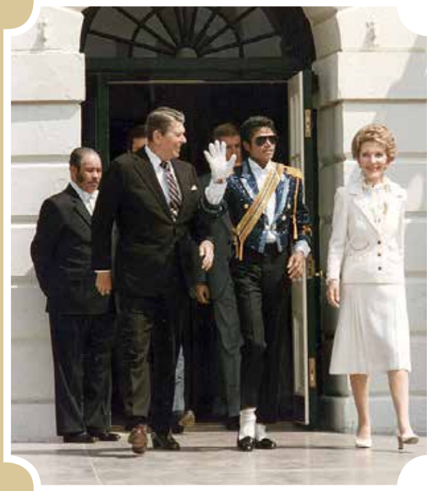
რეიგანების წყვილი მაიკლ ჯექსონთან ერთად, 1984

დღეს რუსეთი საბჭოთა კავშირის აღდგენას ცდილობს. ეს მცდელობა განწირულია, მაგრამ ამას, სამწუხაროდ, ბევრი მსხვერპლიც ახლავს. ამიტომაც ხშირად გაიგონებთ: „ნეტავ რას იზამდა ახლა რეიგანი“, „ახლა რომ რეიგანი ყოფილიყო პრეზიდენტი...“ ალბათ, ბევრი ადამიანი იქნებოდა თანახმა, რომ რეიგანი სამუდამოდ ყოფილიყო ამერიკის პრეზიდენტი.