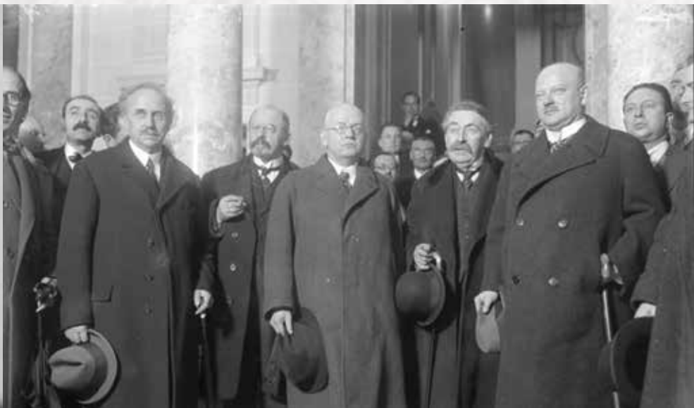
ერთა ლიგის გერმანული, ფრანგული და ბელგიური დელეგაციის წევრები, ფენევა, სექტემბერი, 1926.

პატარა წარმატებებთან ერთად გამოჩნდა ერთა ლიგის სისუსტე და მისი შემქმნელების გულუბრყვილობა და იდეალისტური დამოკიდებულება. საერთაშორისო ურთიერთობებში წამყვან როლს უძლიერესი სახელმწიფოები ასრულებენ. რეალური ძალა მათ ხელშია და ისინი, უპირველეს ყოვლისა, საკუთარი ინტერესების დაცვაზე ზრუნავენ. ფაშისტური იტალიის ხელმძღვანელმა ბენიტო მუსოლინიმ ამიტომაც თქვა ერთა ლიგის შესახებ, რომ „ერთა ლიგა ძალიან კარგია, როცა ბელურები ჟღურტულენ, მაგრამ, როდესაც არწივები გამოფრინდებიან, იგი უვარგისია“. ერთა ლიგა უსუსური აღმოჩნდა აგრესიის რამდენიმე შემთხვევაში, უკვე 20-იან წლებში, რადგან აგრესორის დასასჯელად ძალის გამოყენება არავინ მოისურვა. 1931 წელს იაპონია თავს დაესხა ჩინეთის პროვინცია მანჯურიას. ერთა ლიგამ ვერ აიძულა იაპონია უარი ეთქვა მანჯურიაზე. იაპონიამ კი, თავიდან რომ აეცილებინა კრიტიკა ერთა ლიგაში, 1933 წელს უარი თქვა ლიგის წევრობაზე. არც გერმანიას მოსწონდა ერთა ლიგა და 1933 წელს, ფაშისტი ადოლფ ჰიტლერის გერმანიაში გაბატონებიდან ერთი წლის შემდეგ, გერმანიაც გავიდა ერთა ლიგიდან.