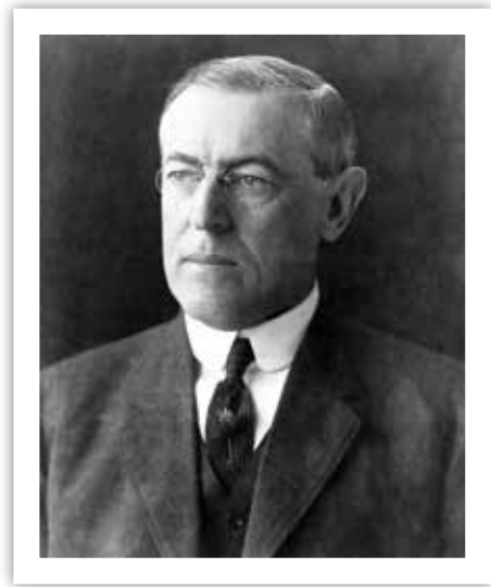
ვუდრო უილსონი (1856-1924) – აშშ-ის 28-ე პრეზიდენტი (1913-1921). მისი მეთაურობით აშშ 1917 წელს ჩაება პირველ მსოფლიო ომში (1914-1918), რამაც გადაარჩინა დიდი ბრიტანეთი და საფრანგეთი და ომის შედეგი მათ სასარგებლოდ გადანყვიტა. ვუდრო უილსონი იყო ომის შემდგომი ვერსალის კონფერენციის (1919) და ერთა ლიგის (1920-1945) სულისჩამდგმელი. ცნობილია უილსონის ე.წ. „14 პუნქტი“, რომლებიც საფუძვლად დაედო პირველი მსოფლიო ომის შემდგომ საერთაშორისო ურთიერთობებს. სწორედ ამ დოკუმენტშია ხაზგასმული „ერთა თვითგამორკვევის პრინციპის“ საყოველთაო გაზიარების აუცილებლობა.

პარიზის კონფერენციაზე იმყოფებოდა დამოუკიდებელი საქართველოს დელეგაცია, რომელიც ამაოდ ცდილობდა გამარჯვებული ქვეყნების ყურადღების მიპყრობას საქართველოს სუვერენულობისა და უსაფრთხოებისაკენ. სამწუხაროდ, დასავლეთის სახელმწიფოებმა მაშინ „ვერ მოიცალეს“ კავკასიის საკითხისა და, კერძოდ, საქართველოსთვის.