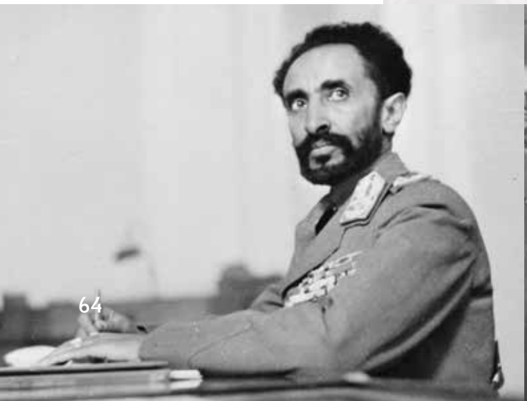
ჰალი სელასი, დაახლ. 1942.

ერთა ლიგა 1920 წლის 21 იანვარს შეიქმნა. მისი ამოცანა საერთაშორისო მშვიდობის უზრუნველყოფა და შესაძლო აგრესორის წინააღმდეგ დამსჯელი სანქციებისა და ძალის გამოყენება იყო. ერთა ლიგაში შეიქმნა საბჭო, რომლის მუდმივი წევრები იყვნენ: დიდი ბრიტანეთი, საფრანგეთი, იტალია და იაპონია. იმედოვნებდნენ, რომ აშშ გახდებოდა ერთა ლიგის ყველაზე გავლენიანი წევრი, მაგრამ მიუხედავად იმისა, რომ ერთა ლიგის ერთ-ერთი სულისჩამდგმელი იყო ამერიკელი პრეზიდენტი ვუდრო უილსონი, 1920 წელს აშშ-ის სენატმა უარი თქვა ერთა ლიგის წევრობაზე. აშშ-ის სენატის აზრით, არავის უნდა შეძლებოდა მდგარიყო აშშ-ის ხელისუფლებაზე მალა, არც ერთი საერთაშორისო ორგანო არ უნდა ყოფილიყო აშშ-ზე უზენაესი. ამ გარემოებამ თავიდანვე შეასუსტა ერთა ლიგა.