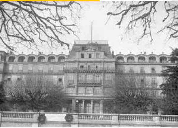
ერთა ლიგის შენობა ფენევაში, 1931.

დე ფაქტო (de facto) – ნიშნავს ფაქტობრივად არსებულს, მაგრამ არა სამართლებრივად, კანონიერად აღიარებულს.